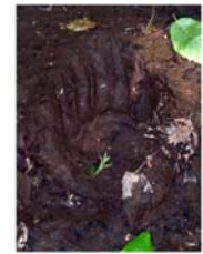
À gauche, empreinte de loup. À droite, empreinte d'ours

Ces deux espèces animales sont présentes dans la région du mont O'Brien. Le loup a quatre doigts sur ses traces de pas, l'ours cinq.