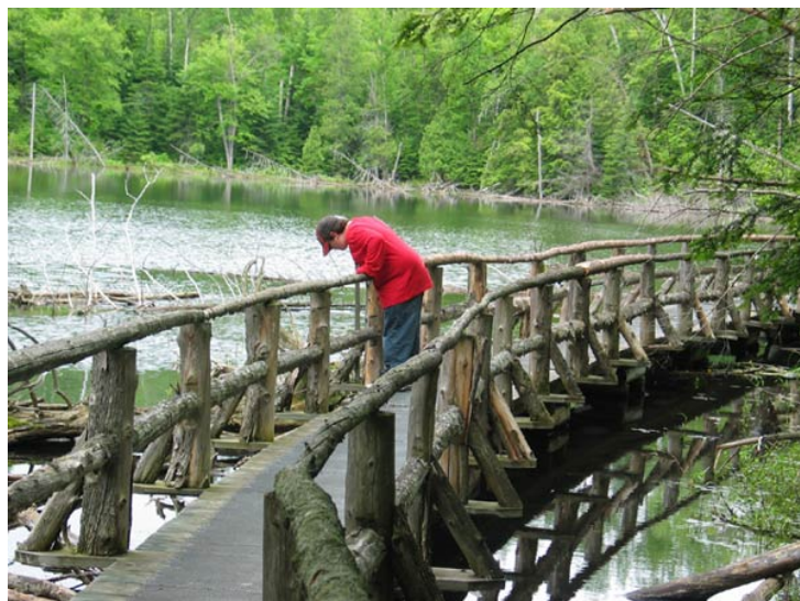
L'un de nos rêves est de construire une passerelle au bord d'un lac ou d'un marécage, semblable à celle-ci, construite par des bénévoles de la Forêt La Blanche avec des matériaux locaux.