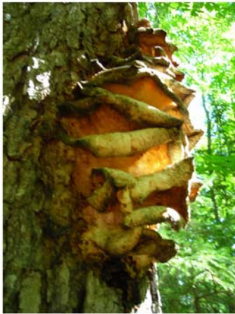
L'année dernière a été une année exceptionnelle pour les champignons de couleur dans notre région. Ci-dessus: Climacodon septentrionale (Polypore à dents du nord). Amenez votre appareil photo!

Les objectifs fixés dans la nouvelle politique du ministère des Ressources naturelles (MRNF) prévoient cependant une protection accrue des forêts mûres et surannées. C'est une bonne chose pour de nombreuses espèces d'oiseaux et de petits animaux qui tirent parti des gros arbres creux, qu'ils soient vivants (ils produisent alors glands et faines) ou morts (chicots et troncs au sol). Le volet 4a de la politique devait être mis en œuvre au début de 2006 avec la mise de côté de plus d'un millier de petits "refuges" (de 50-150 ha), répartis également dans la forêt publique québécoise – et ce, pour permettre la croissance jusqu'au stade de la futaie. Bien qu'ils aient tous déjà fait l'objet de coupes partielles au moins une fois dans le passé, ces refuges sont censés échapper ainsi à jamais aux coupes et à l'aménagement de routes forestières.