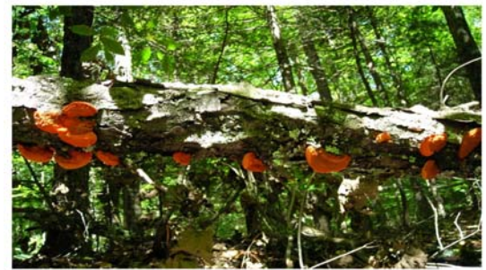
Tramète cinabre sur un tronc de cerisier tardif

Pour en savoir plus sur les « onze objectifs », visitez www.mrnf.gouv.qc.ca . Cliquez sur "les forêts", puis sur "Consultation du public et des partenaires", puis au bas de la page sur "Objectifs de protection et de mise en valeur des ressources du milieu forestier". Sous la rubrique "Documents découlant des résultats de la consultation publique", sélectionnez "Objectifs de protection et de mise en valeur des ressources du milieu forestier - Plans généraux d'aménagement forestier 2007-2012". On peut aussi appeler sans frais le (866) 248-6936 (demander le code 2004-3041 pour l'anglais ou le code 2004-3040 pour le français) ou envoyer un courriel à service.citoyens@mrnf.gouv.qc.ca . Vous pouvez aussi lire le rapport Coulombe sur le site Web du ministère ou l'obtenir par téléphone.