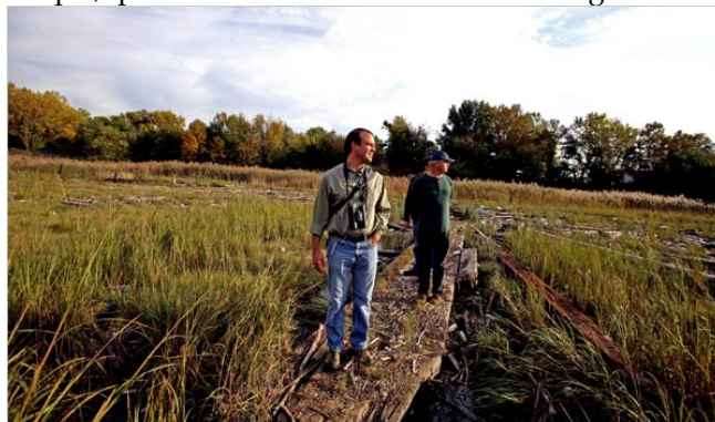
De vieilles planches de pruche et de cèdre, deux essences résistant à la pourriture : c'est tout ce qu'il fallait pour construire ce sentier traversant un marécage de Virginie.

L'une de nos principales stratégies de protection de la forêt consistera à créer des sentiers de randonnée sur le territoire de 25 milles carrés. Certains sentiers devraient, évidemment, être en terrain dégagé, comme celui, tout simple, qui traverse une zone humide en Virginie :