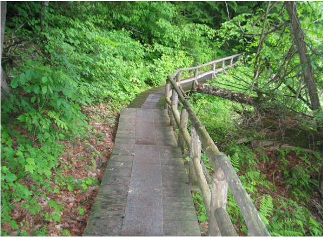
Ce sentier permet aux randonneurs de franchir le flanc d'une colline en toute sécurité.

Ces sentiers doivent non seulement guider les randonneurs vers des lieux dignes d'intérêt, ils doivent aussi, et surtout, servir à empêcher l'érosion du sol et le piétinement des végétaux.