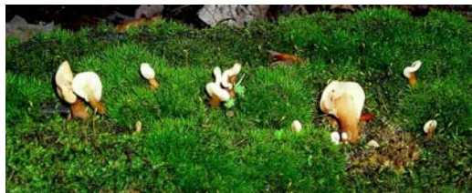
La spatulaire jaune, poussant sur un vieux tronc en décomposition, couvert de mousse

mis en réserve pour permettre aux peuplements d'atteindre le stade de forêt ancienne, avec ses gros arbres creux vivants, ses chicots, ses petits cours d'eau non perturbés et ses grands arbres creux jonchant le sol qui servent de refuge et d'habitat à un grand nombre d'espèces animales et végétales. Un secteur de 200 acres de forêt mature, situé sur une colline au sud du territoire du mont O'Brien sera ainsi sauvé. L'un de nos futurs sentiers passera là, près d'un petit cours d'eau.