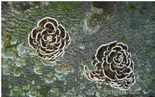
Rosettes de champignons polypores sur un tronc de hêtre jonchant le sol

Aménagés avec soin, les sentiers de randonnée permettent d'observer la nature, de loin ou de près.