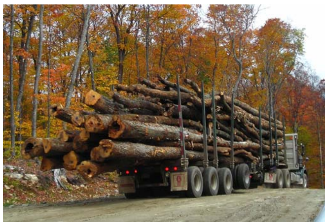
Ce qui nous guette entre 2008 et 2013 : l'abattage de vieux arbres destinés à la fabrication de pâte à papier

Des coupes forestières sont prévues entre 2008 et 2013 sur la colline à escarpements rocheux connue localement sous le nom de Rocky face , ainsi que sur une superficie d'un mile 2 dans la forêt voisine. Une consultation publique sur la gestion des forêts s'est tenue de la fin août au début octobre.