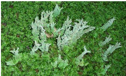
Le lichen Cladonia poussant dans la mousse recouvrant une roche