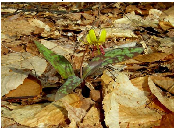
La vie reprend au mont O'Brien: floraison au début de mai de l'érythronium d'Amérique ("Yellow trout lily").